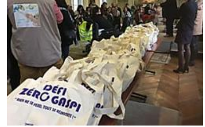
Le défi Zéro Gaspi, c'est parti !