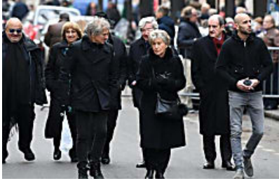
Inhumation de France Gall en présence des proches et de fans