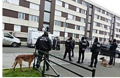
Où sont passés les agents de sécurité au Clos-des-Roses à Compiègne ?